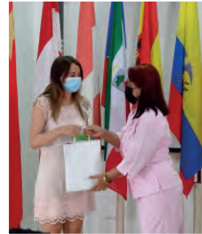
Categoría: Periodistas y comunicadores

E n el contexto de la 10ma. Conferencia Científica Internacional, la Universidad de Holguín entregó, por primera vez, el Premio de Comunicación Científica Scientia Maxime, destinado a reconocer la labor de periodistas, comunicadores, profesores investigadores, estudiantes, recién graduados, y de entidades del territorio, en pos de visibilizar la ciencia universitaria.